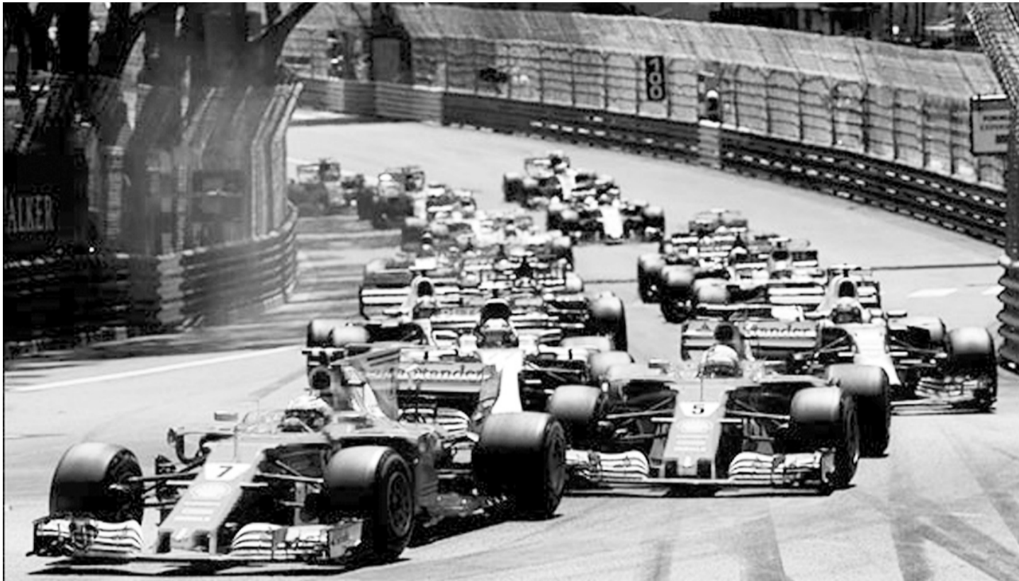
Після тривалої перерви «Феррарі» знову перемогло у Монте-Карло.

«Феррарі» вперше з 2001 року відсвяткувало перемогу на Гран-прі Монако