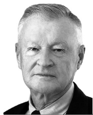
Збігнев Бжезинський видатний політолог

«Росія може бути або імперією, або демократією, але не тим і іншим одночасно... Без України Росія перестане бути імперією, з Україною ж, підкупленою, а потім і підкореною, Росія автоматично перетворюється на імперію».