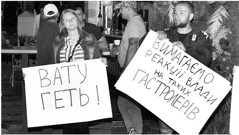
Активісти вимагають від співачки чіткої громадської позиції.

Співачці, яка виступає в Росії, довелося рятуватися втечею від розлюченого натовпу патріотів