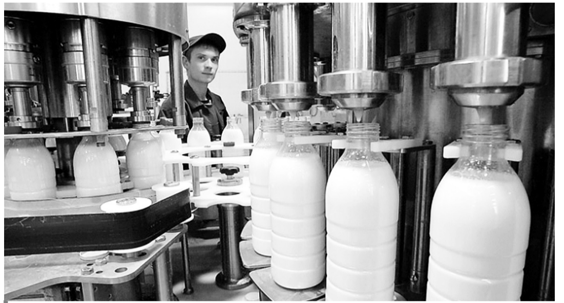
Технологічно виробники молочки зробили все можливе. Лишається домовитися про взаємовигідні правила гри.

Об'єднатися заради спільних прибутків — розумніше, ніж торгуватися