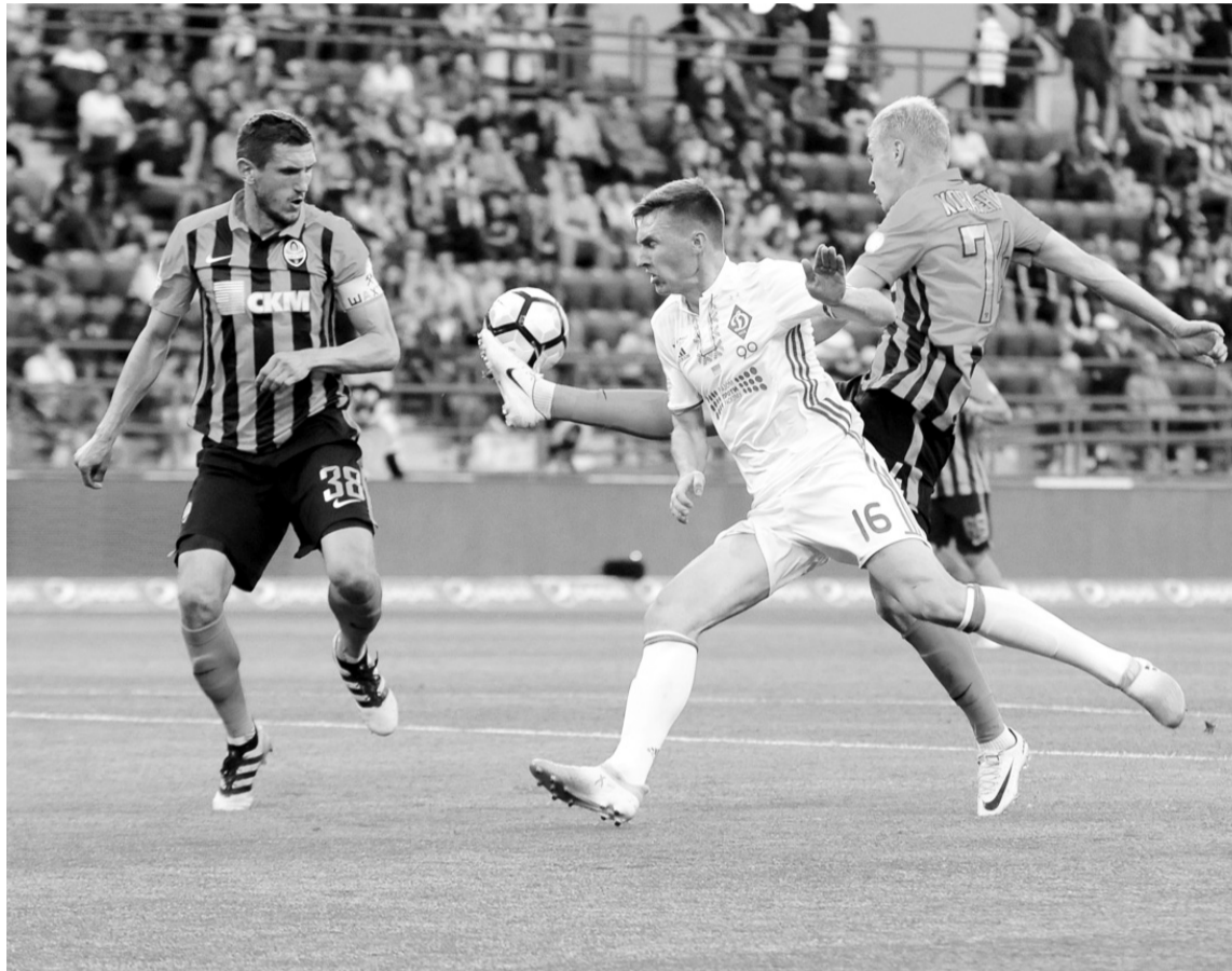
По суті, без боротьби програвши «гірникам» чемпіонат, у його кінцівці динамівці завдали «Шахтарю» першої за багато років поразки в турнірі.

Примітно, що урочиста церемонія проходила на тлі першої за останні 2,5 року поразки «Шахтаря» в чемпіонаті своєю головному конкуренту. Оскільки поєдинок 31-го туру між «помаранчево-чорними» та «Динамо» не мав жодного турнірно-