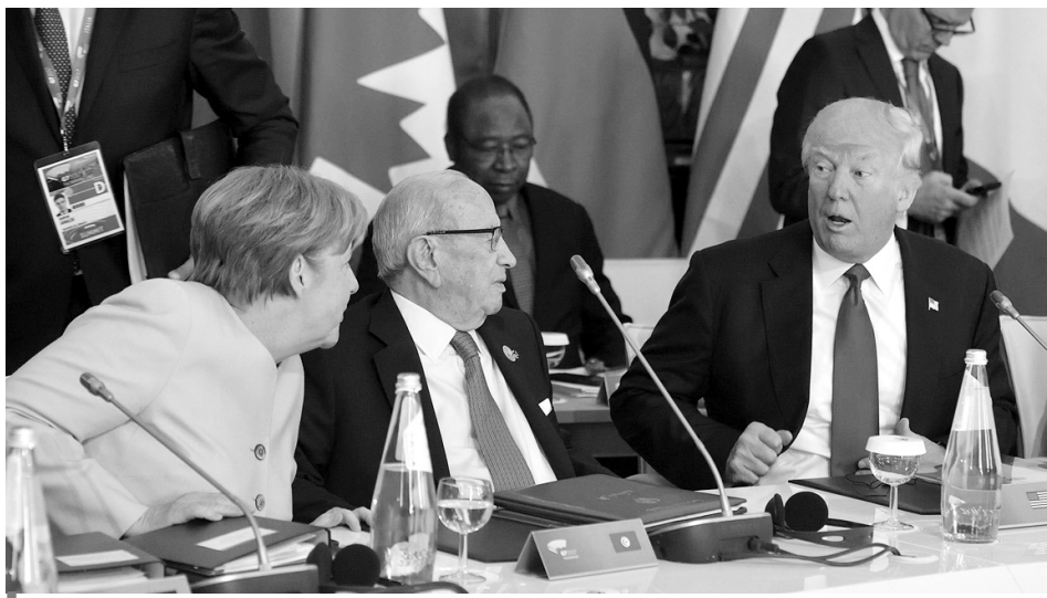
Гостра перепалка між Меркель і Трампом.

Лідери «Великої сімки» ледь змогли уникнути повного розколу