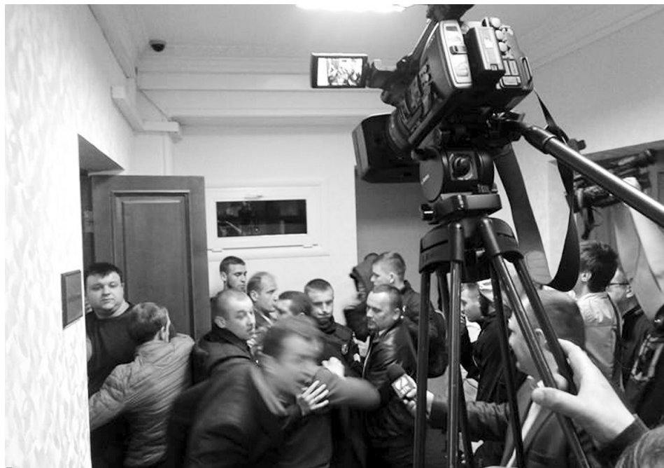
Заколот районного масштабу.