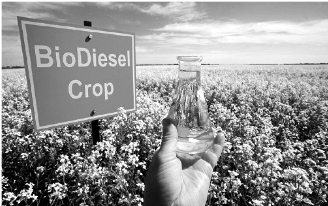
Пальне, що не шкодить довкіллю, — це далеко не все, що можна отримати з ріпаку.