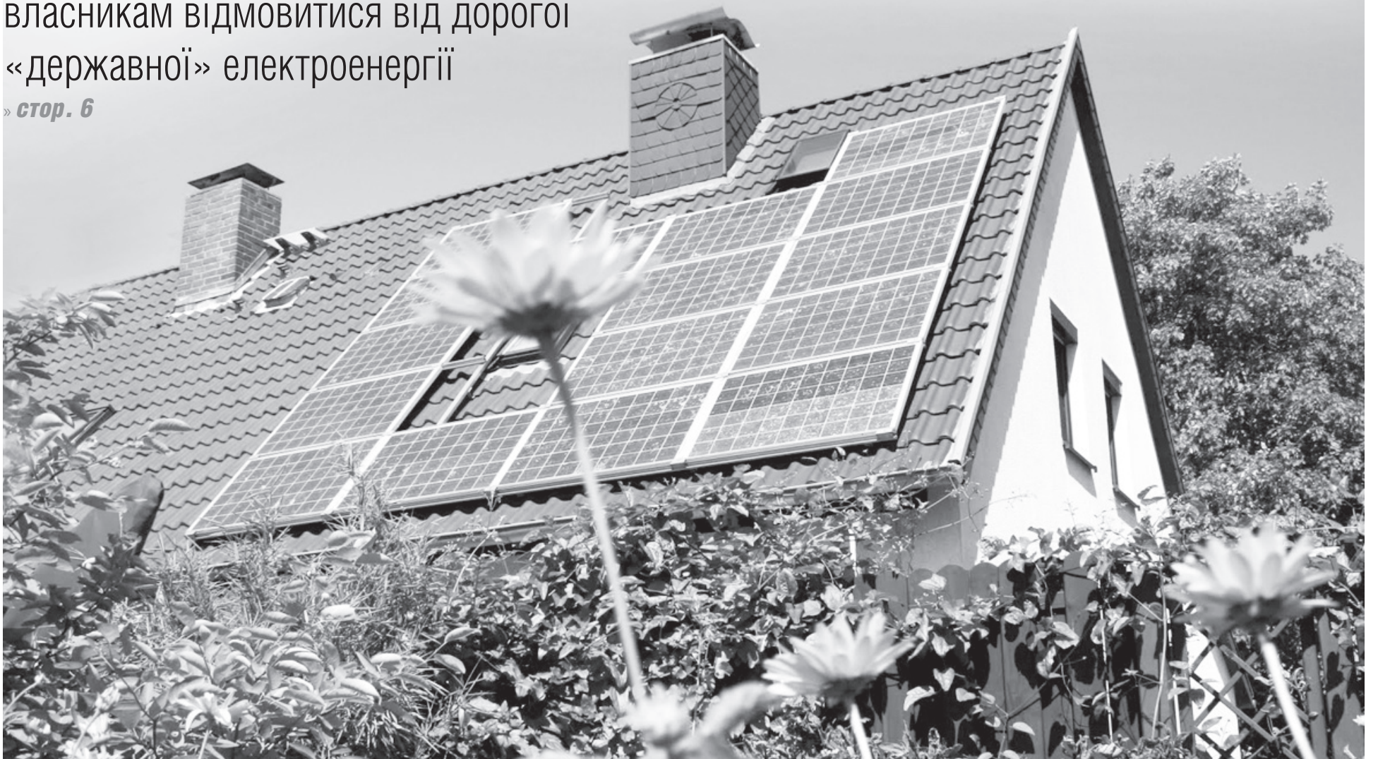
Як справжні газди, вітчизняні бізнесмени та пересічні українці не хочуть, аби сонце у нас світило просто так.

Поспішіть передплатити «Україну молоду» на друге півріччя