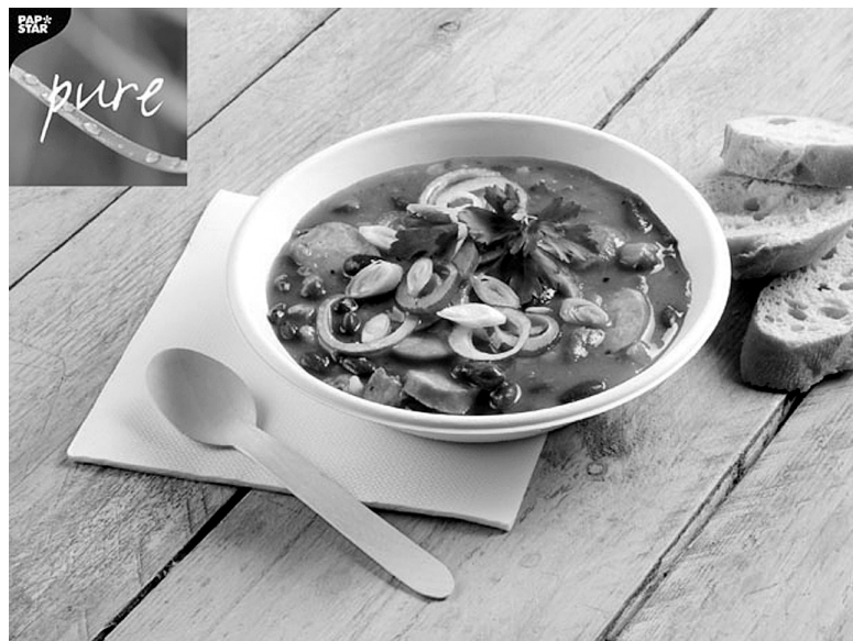
Після трапези цей посуд стане... добривом.

Новий екологічний посуд виготовляють із тростини, яка має надзвичайно швидкі темпи росту, тому проблем із сировиною не очікується. Також посуд із тростини гарантує кращу якість і міцність, ніж аналогічні вироби з паперу чи дерев'яної суміші. Також розробники фірми надали виробам із тростини елегантного вигляду, тому їх можна використовувати не лише на пікніках, а й також удома чи в рестораних закладах. Вони нададуть закладам харчування реноме таких, що піклуються про природу. ■