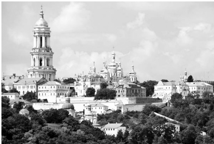
Києво-Печерська лавра.

раніше, ніж село Лютеція? Невже античні історики не залишили якоїсь письмової згадки про нього? Аналіз творів античних авторів привів до Клавдія Птолемея, давньогрецького вченого, автора знаменитого твору «Географія», в якому він подає географічні координати (довготи і широти) близько 8 тисяч населених пунктів нашої планети, в тому числі координати 5 поселень, розташованих по Дніпру. Жив знаменитий географ у II ст. н.е., коли Київ, як визначив Самойловський, уже існував, тому інформація про Київ повинна була потрапити до твору Птолемея. Але, на жаль, координати жодного із вказаних Птолемеєм подніпровських поселень не збігалися з координатами Києва. Тому вирішено було дослідити, якими ж засобами користувалися античні вчені для вимірювання координат, якими були похибки їхніх засобів, чи можна якось відсіяти ці похибки, спираючись на сучасні знання. Виявилося, що у греків найточнішим засобом для вимірювання широт був гномон — вертикальний стрижень, встановлений на горизонтальному майданчику. Сонячна тінь від стрижня несе в собі багато інформації про рух і навіть розміри нашої планети. Автор книги з онуком спорудили такий гномон у себе на дачі і почали дослідження. (Для всіх, у кого є діти або внуки, варто зайнятися цією справою — над-