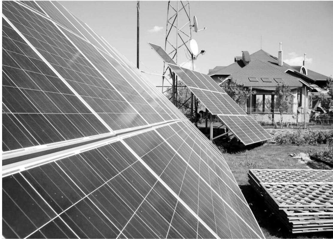
Сонячні батареї біля садиби дозволяють не тільки перестати отримувати рахунки за електроенергію, а й заробляти, продаючи свою електрику державі.

Утім енергонезалежність України створює не лише держава та великі інвестори, здатні вкладати у проекти десятки мільйонів доларів. Сонячна генерація доволі доступна і пересічним українцям, які встановлюють у своїх садибах міні-електростанції і не лише забезпечу-