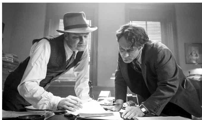
Кадр із фільму «Геній».

Американсько-британський біографічно-драматичний фільм знятий Майклом Грандаджем за романом «Макс Перкінс: Редактор генія» (1978) Ен-