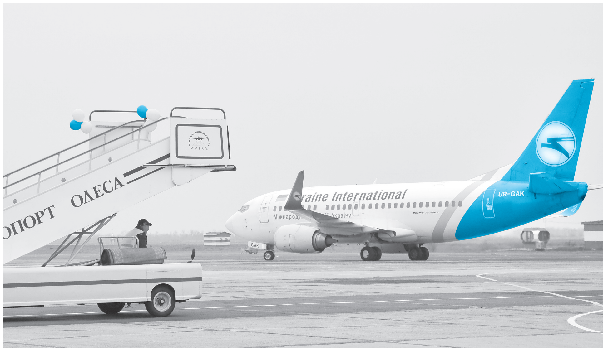
Авіакомпанії, схоже, подолали кризовий шок — і нині готові возити пасажирів в інші українські аеропорти, замість зруйнованих, а також прокладати нові маршрути: по країні і за кордон.