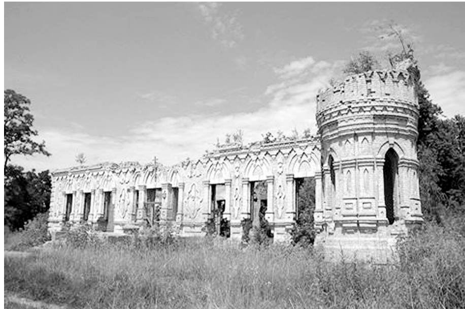
Руїни маєтку графського роду Osten-Sakenів у селищі Немішаєве. Фото з соціальної мережі.

Покажуть виставу «АТО: інтерв'ю військового психолога» режисера Андрія Май-Малахова херсонського Центру імені Всеволода Мейрхоляда. Вона