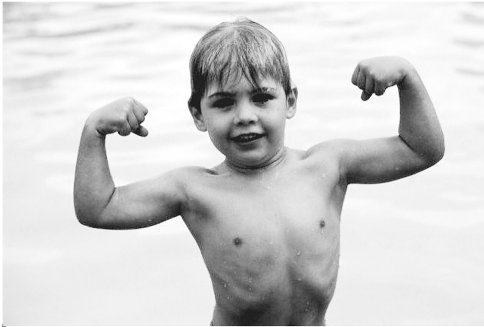
Літо — прекрасний час для загартування організму.

«Загартування природою» зміцнює опірність організму несприятливим впливам довкілля