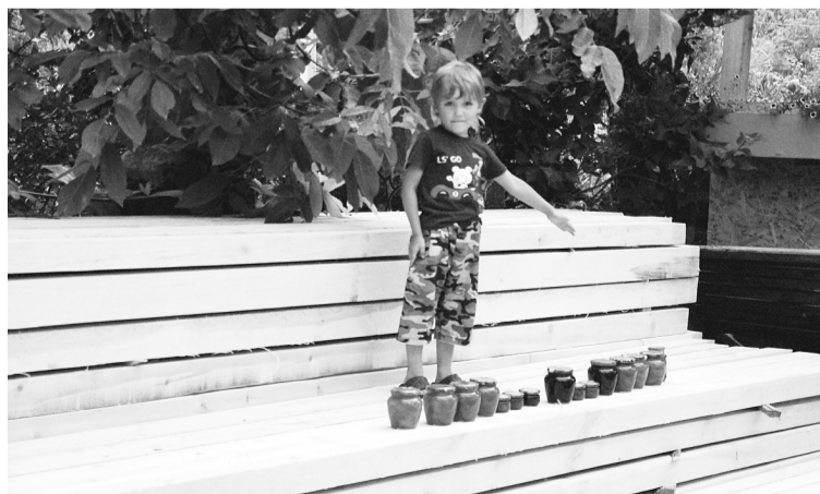
Паровозик із баночок варення.