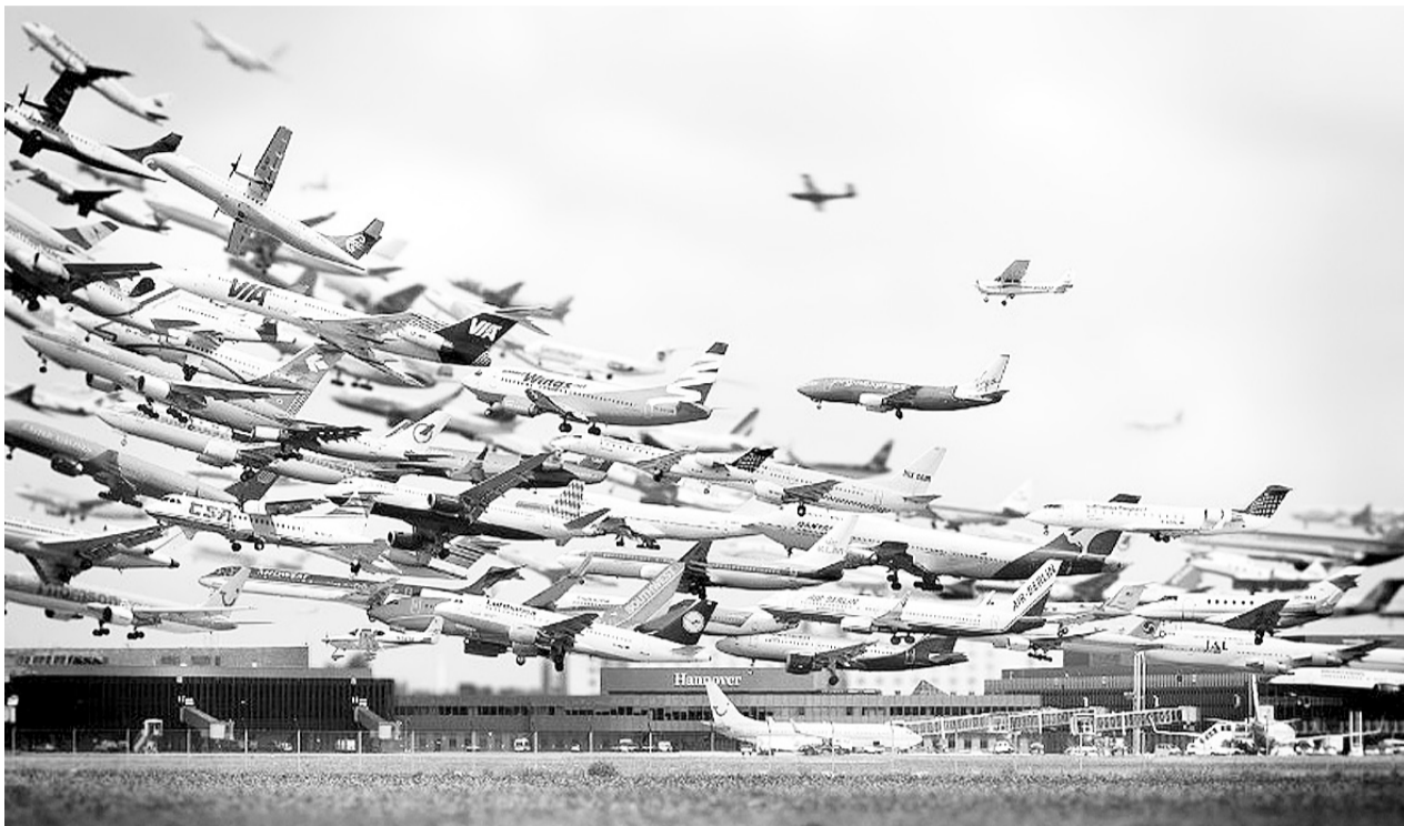
«Зграї» літаків над українськими аеропортами — мрія нашого пасажера. Адже тільки висока конкуренція здатна знизити ціни.

В Україні поступово відновлюється авіаційне сполучення: як внутрішнє, так і міжнародне