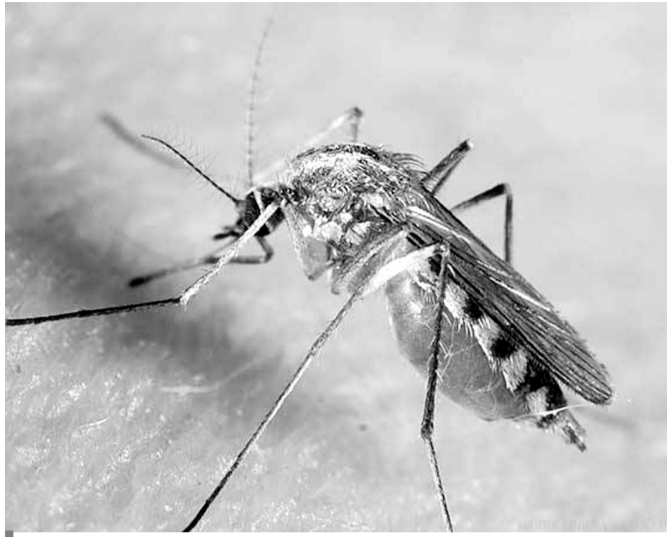
Алергічні місцеві реакції — один із наслідків укусів комарів.

Комарина навала на півострів Крим стало предметом розгляду на екстреному засіданні санітарно-епідемічної комісії, яка працює при нинішньому уряді окупованого півострова Крим. На даний час проводиться низка профілактич-