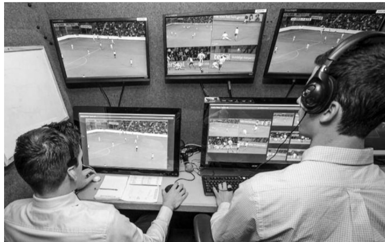
Команда відеопомічників із різних ракурсів стежить за дотриманням правил під час футбольного протистояння.