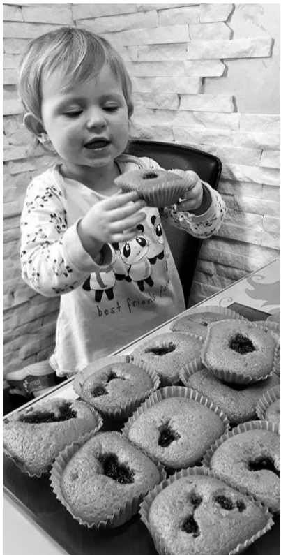
Кекси Аніти Камінечної.

Знадобиться: по склянці кефіру та цукру, яйце, 2 склянки борошна, по 50 г варення і родзинок, 3 столові ложки олії, чайна ложка погашеної оцтом соди.