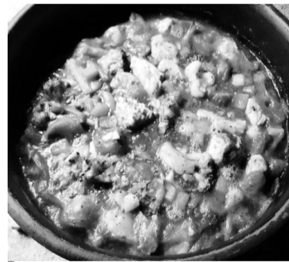
Печеня з овочами.

На середньому вогні протушкувати шматочки індички з невеликою кількістю води. Як будуть готові, викласти у горщик або форму для запікання. Підготувати овочі: цибулю-моркву нарізати кубиками, цвітну капусту, броколі трохи приварити, порізати на менші шматки, якщо завеликі. Брюссельська й так замала, але я різала навпіл. Якщо овочі заморожені з пакету, достатньо просто розморозити у мікрохвильовці. Так само протушкувати овочі з невеликою