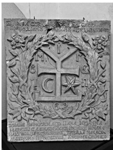
Герб Івана Мазепи на закладній дошці Чернігівського колегіуму.

ля 333-літнього «єгипетського полону» українці нарешті отримали власну, а не керовану із сусідньої держави церкву.