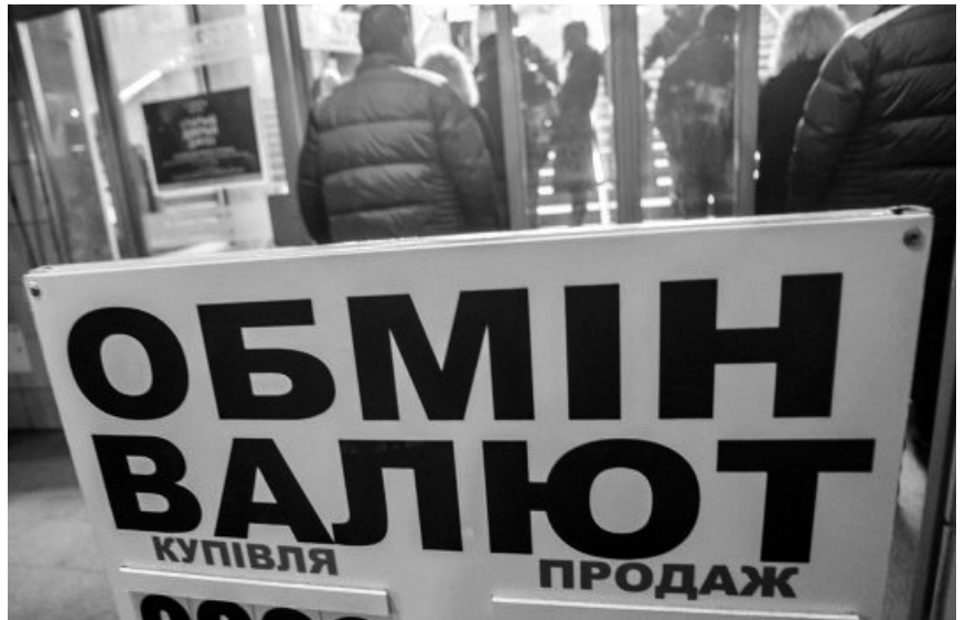
Фінансові експерти вірять у перспективи гривні.

Аналітики спростовують теорії, що влада «тримає» курс гривні до виборів, а причиною зміцнення вважають рекордний урожай зернових, який зараз активно почали продавати