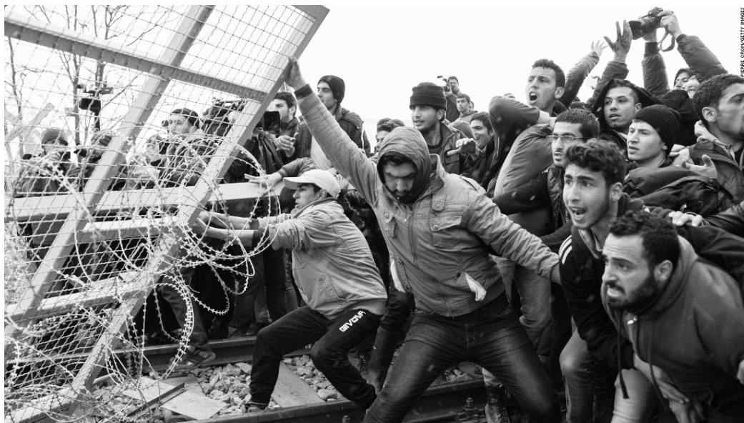
Наплив таких «трудових резервів» Німеччина хоче обмежити.

Усі зроблені на конференції правлячих партій у Берліні заяви та рішення свідчать про відхід від незваженої та згубної політи-