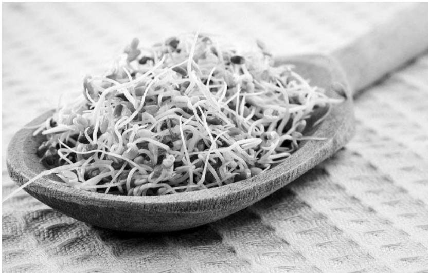
Мікрогрин в Україні вже вирощують не лише на підвіконнях «для себе», а й у промислових масштабах для широкого продажу.

Найпопулярнішими прикладами біогенних харчів в Україні стало проросле насіння і паростки соняшнику, гарбуза, льону, кунжуту, а також пророщені зерна пшениці, жита, ячменю, амаранту, гірчиці, нуту. Це — найбільш цілюща їжа, що здавна застосовується як природний допінг і найкращі ліки. Вона містить біологічну енергію в максимальній фазі своєї активності, підвищує фізичну і психічну силу людини. Проростки — найкращі постачальники ферментів (ензимів, джерел життєвої енергії), вітамінів, харчових волокон (клітковини), амінокислот, жирних кислот. Вони містять приблизно в 40 разів більше природних ферментів, ніж будь-які інші прости природні продукти. А ще одна їхня важлива складова — антиоксиданти, які запобігають руйнуванню ДНК, що сприяє продовженню життя.