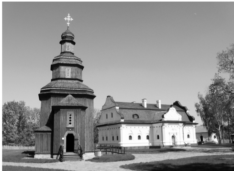
Двір Цитаделі в Батурині. Урядовий квартал часів Івана Мазепи.

Ось так з «особливим цинізмом» московська церква сотні років привчала людей не пам'ятати свої попередні слів. Маючи сотні років і соціальну функцію головного зберігача національної пам'яті, церква є чи не найбільш відповідальною за спотворення історичної пам'яті про гетьмана Мазепу. На щастя, піс-