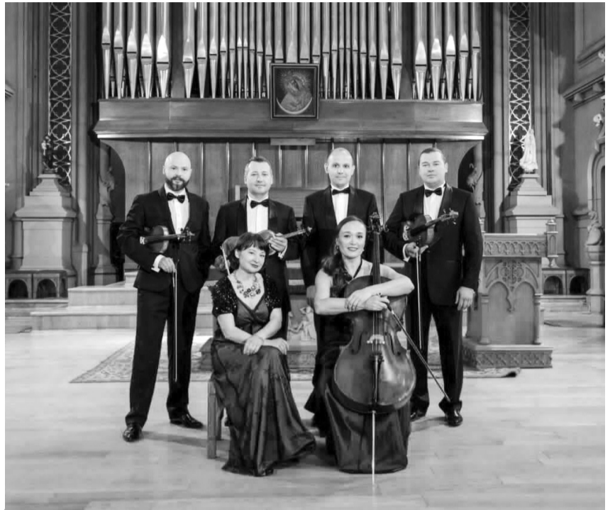
Камерний ансамбль «Київ».