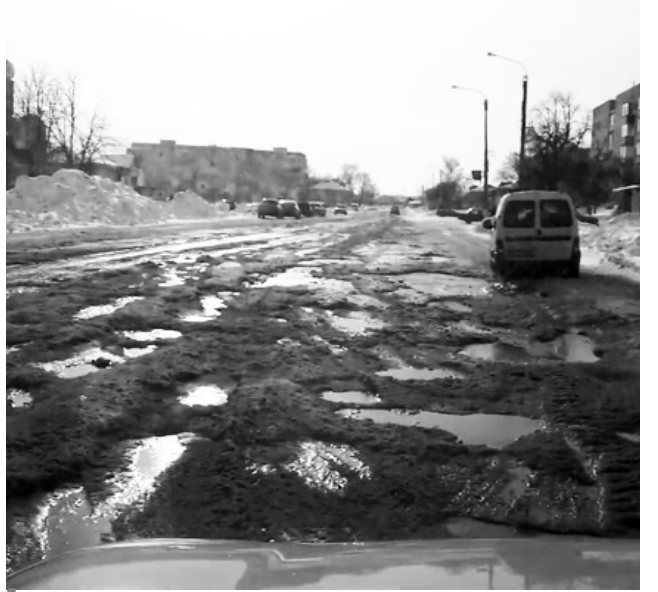
Черкаські дороги, які минулоріч стали притчею во язицех автомобілістів, обіцяють відремонтувати.

На Черкащині діри на відремонтованих дорогах лататимуть за гарантією