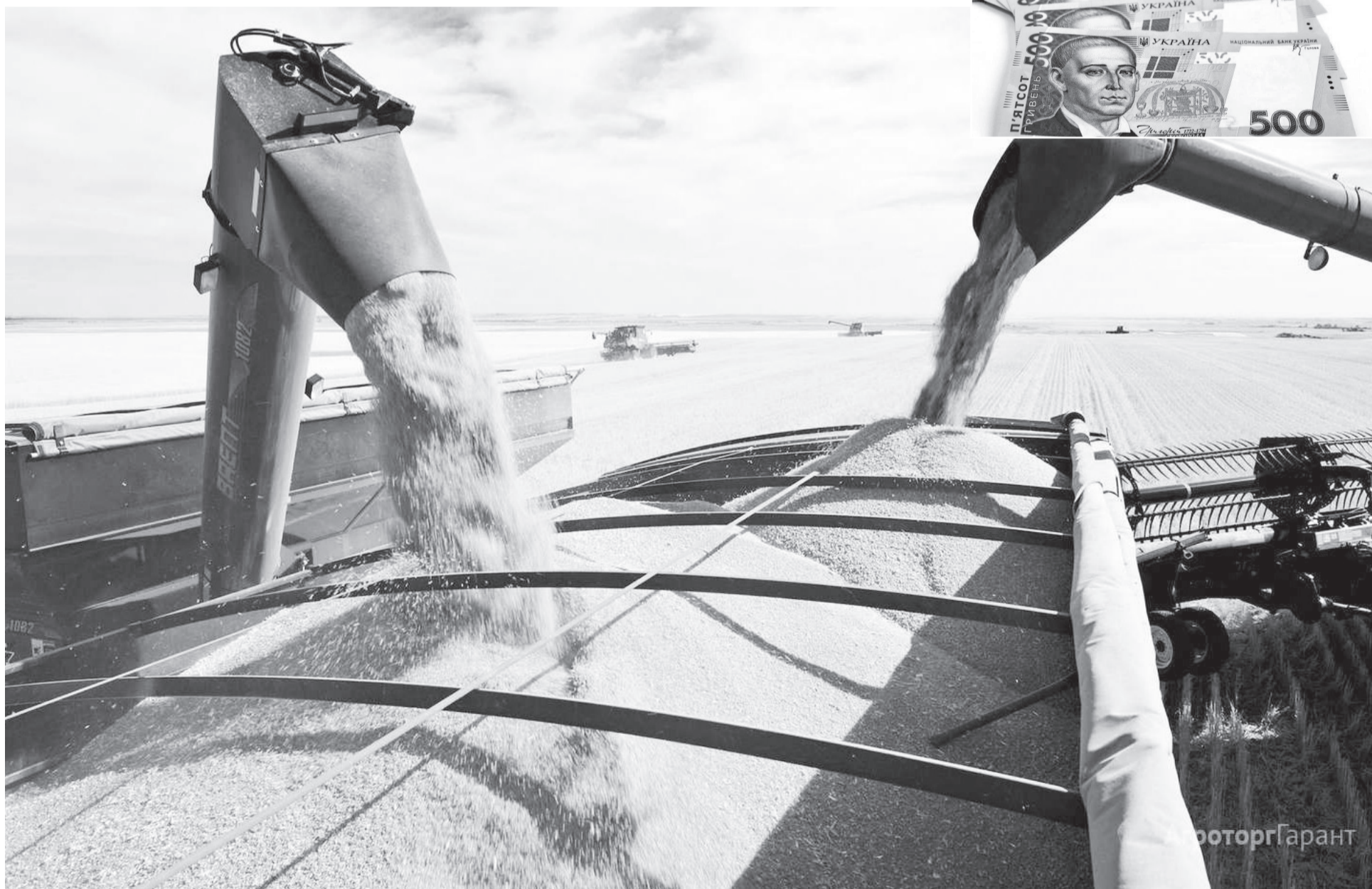
Літні звітяги аграріїв і взимку «гріють».