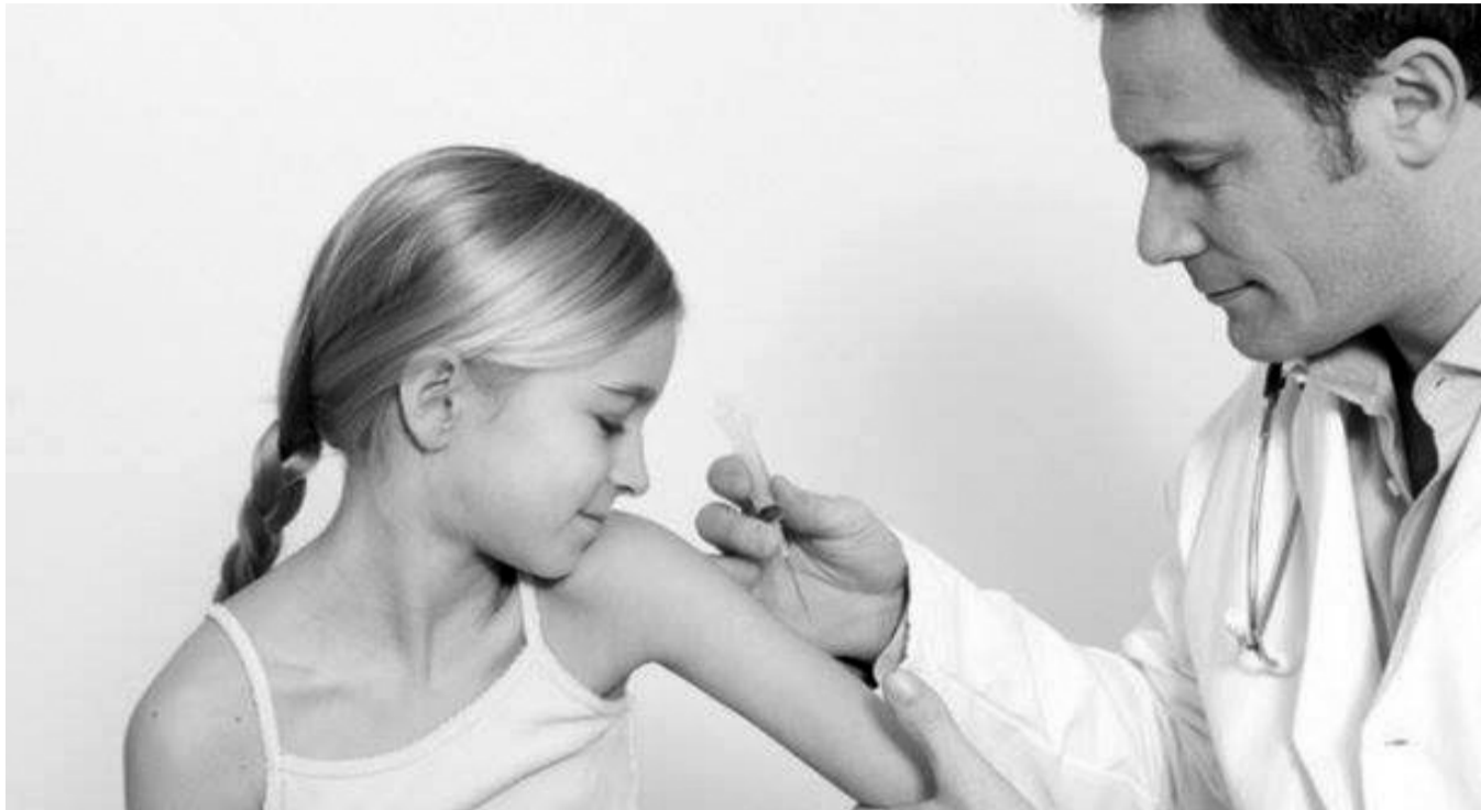
Ліків від кору немає. Захищає лише щеплення.

Що треба знати про вірус кору і як вберегтися від цієї хвороби?