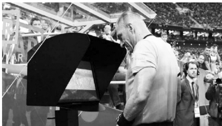
Головний арбітр матчу повинен самостійно переглядати суперечливі моменти.

Не маючи можливості більше затягувати процес, в УЄФА запровадили систему VAR на матчах Ліги чемпіонів