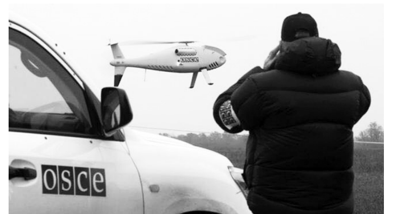
Місію ОБСЄ не надто напружують обстріли російських окупаційних військ — можна в комфорті моніторити території, контрольовані Україною.

вої техніки та озброєння. Практикують вони і збиття БПЛА далекого радіусу дії, які використовуються СММ ОБСЄ для моніторингу чутливих для РФ ділянок, де здійснюється розміщення озброєння через кордон у нічний час. Після таких випадків СММ переглянуло маршрути безпілотників, аби уникати таких «потенційно небезпечних» ділянок, що неприйнятно з огляду на місію незалежного моніторингу. Адаже за таких умов СММ ОБСЄ здійснює моніторинг окупованих територій Донбасу винятково в тих місцях, де безпечно, тобто де відсутня значна кількість військової техніки та порушень