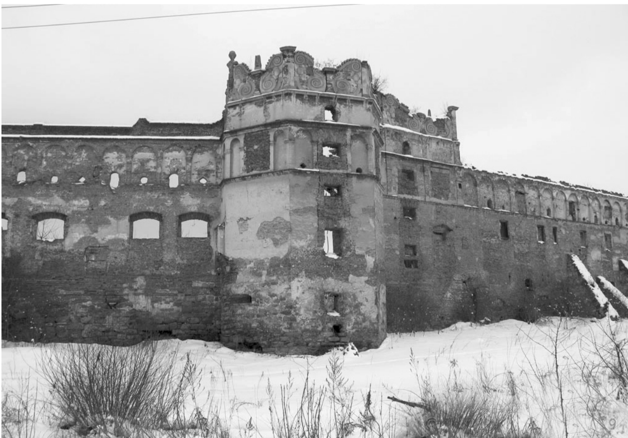
Львівщині припадає чи не найбільше замків, що налічуються по всій Україні. На цих землях розташований й один із найбільших замків усієї країни — Старосільський, що в Пустомитівському районі. Площа цієї пам'ятки історії складає 2 (!) гектари. Замок князів Острозьких побудований у 1584-1589 роках у стилі східноєвропейського пізнього ренесансу, його 14-16-метрові стіни прикрашають аркатури, а фронти башт — барокова різьба по каменю, які частково збереглися й до тепер. У 2010 році замок передали у концесію, але відповідні роботи з реставрації не проводили, тож зараз стоїть завдання зробити так, щоб зберегти бодай те, що ще залишилося.