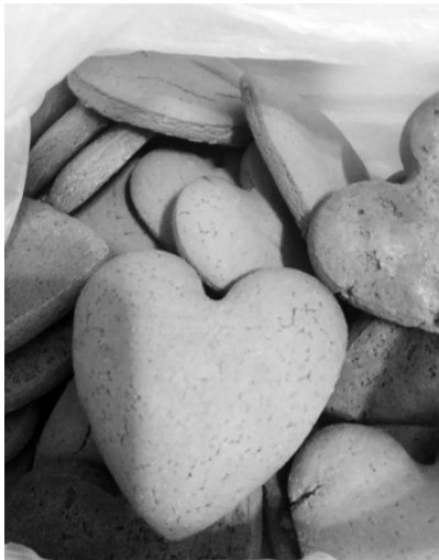
Пряники-сердечка Лесі Фанди.