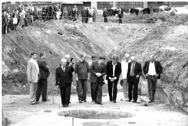
Президент Віктор Ющенко оглядає розкопки на території фортеці Батурина.

Московське «кадило брехні» не витравило добру пам'ять про найдостойнішого Гетьмана України