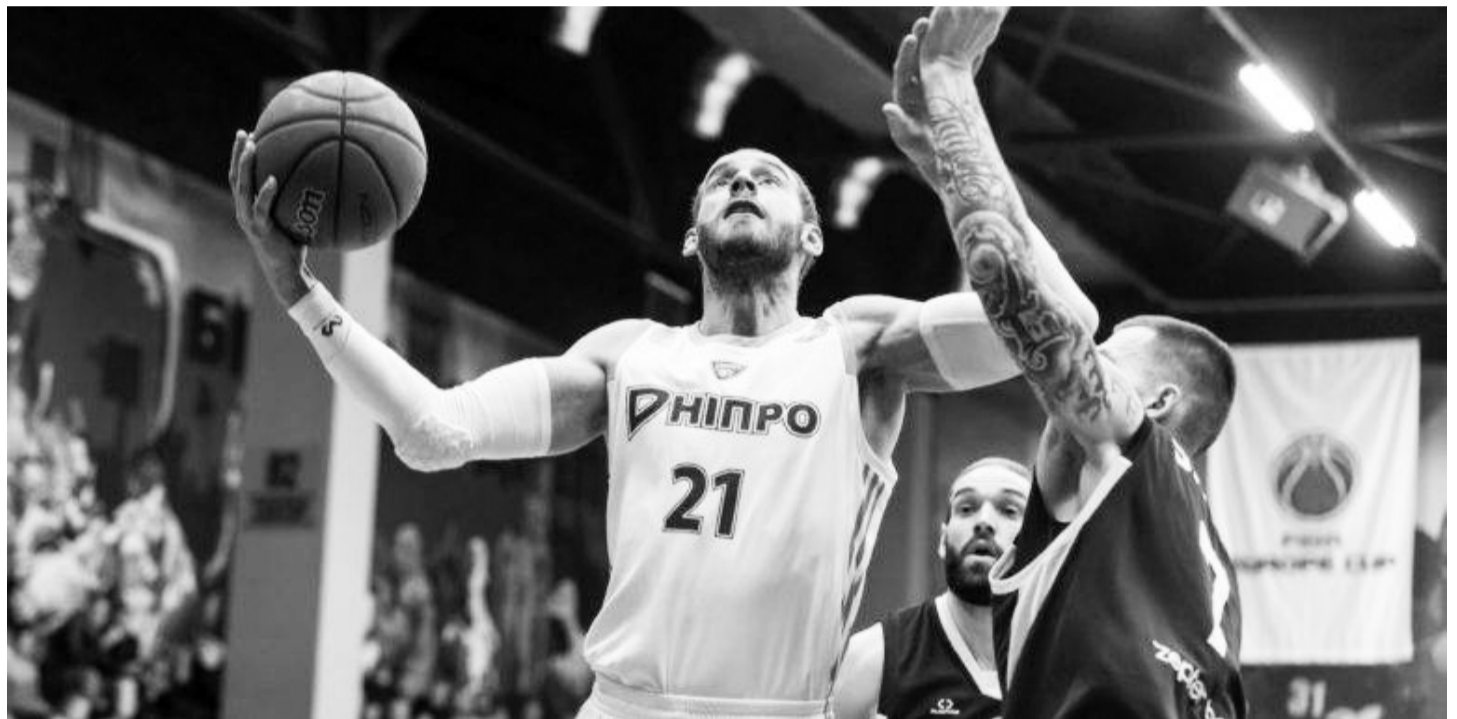
Після переконливої домашньої перемоги над лідером групи у «Дніпра» з'явився шанс на подолання першого групового бар'єру Кубка Європи.

Український віце-чемпіон достроково пробився до наступного раунду Кубка Європи