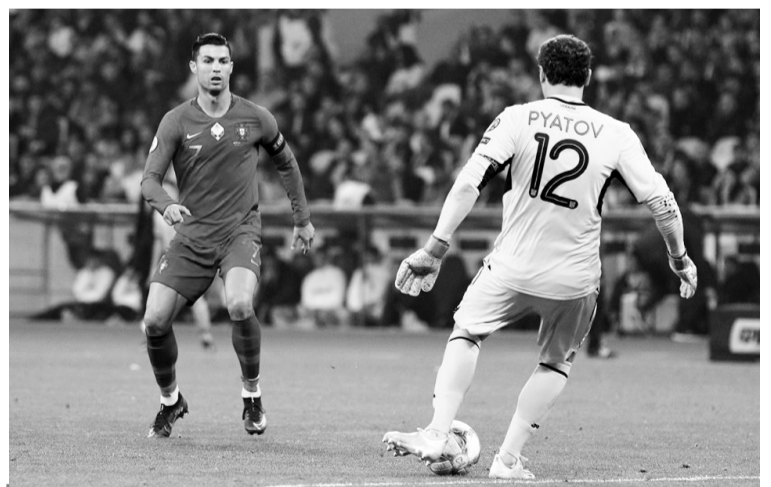
Після матчів кваліфікації збірна України може зустрітися з командою зіркового Кріштіану Роналду тепер і на груповій стадії фінальної частини Євро-2020.

Щодо складу групи С, де «маткою» буде збірна України, а її матчі відбудуться в Амстердамі та Бухаресті, то вже точно відомо, що команді Шевченка «на чужій території» доведеться суперничати з нідерландця-