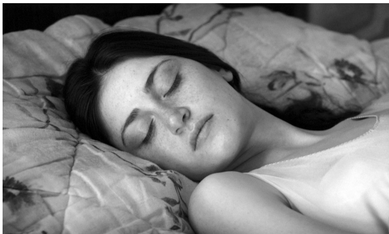
«Що ми бачимо, коли дивимось на небо».

Уже на п'ятій фестивалний день стануть відомими володарі «Золотого ведмеда» і купи «срібних» — їх вручатимуть, щоправда, вже в червні, коли відбудеться друга частина Берлінале, з глядачами. Бо ж ця перша, спринтерська фаза — онлайнівська — тримає глядацьку масу на сторожкій і санітарно обумовленій дистанції.