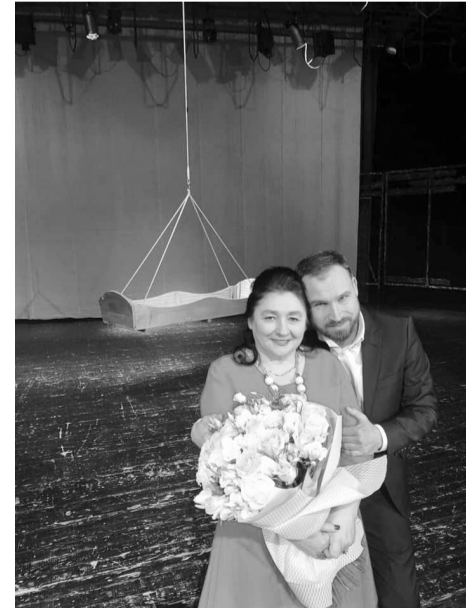
Марія Матіос та Ростислав Держипільський.

трофи ми зіграємо для самопоселенців та співробітників зони відчуження. Гратимемо в Будинку культури міста Чорнобиль, найбільше відомому тим, що саме там відбувався суд над винуватцями Чорнобильської аварії. У Чорнобилі ми зможемо побувати завдяки партнерству з Державним агентством з управління зоною відчуження та Міжнародною громадською організацією «Центр Прип'ять.ком».