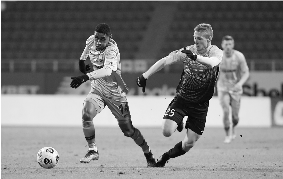
Резервний склад «Шахтаря» не впорався з лідером першої ліги — «Агробізнесом».

Удруге поспіль донецький «Шахтар» неймовірно рано вилетів із Кубка України