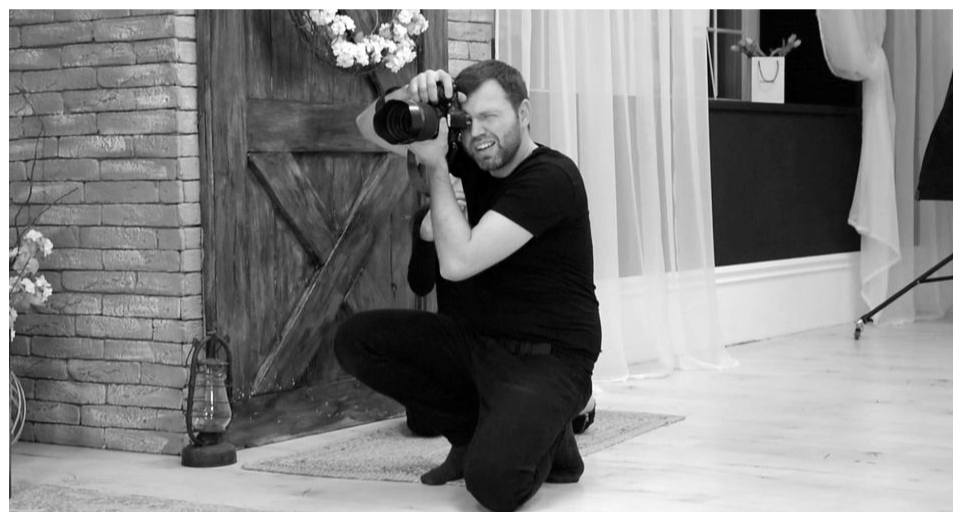
Щасливі миті життя фіксує фотомайстер Олександр Фостик.