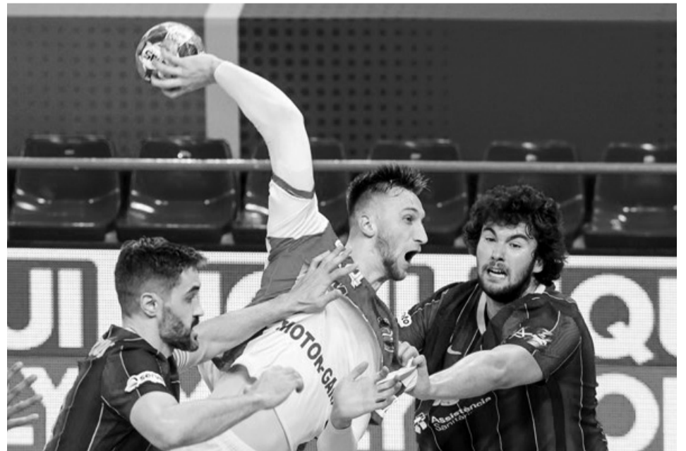
І в другому матчі групового раунду Ліги чемпіонів «Барселона» виявилася сильнішою за запорізький «Мотор».

Заключний матч групи «мотористи» проводили в Барселоні — проти найтитулованішої команди європейського гандболу. У нинішньому розіграші ЛЧ українській команді вперше випало помірятися силами з «Барсоєю». У «Моторі» кажуть, що обов'язково зроблять висновки з пройдених уроків. У Каталонії команда Савукінаса дозволила закинути опонен-