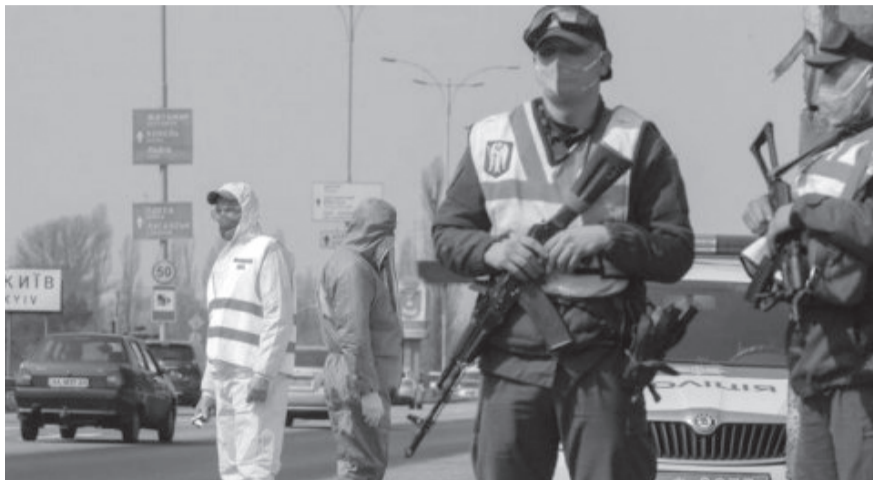
Правоохоронці на Івано-Франківщині стежать за дотриманням карантинних обмежень.

Водночас у МОЗ не виключають затримок із поставками вакцин. Пізніше, ніж очікували, може надійти препарат від китайської компанії Sinovac. Через дефіцит вакцин також переноситься поставка від Pfizer у рамках ініціативи COVAX.