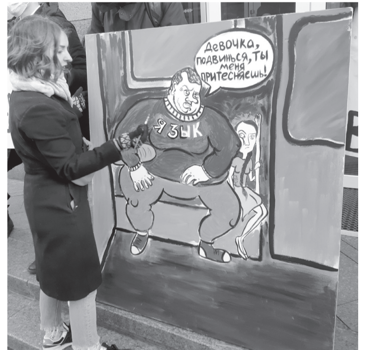
Просто під час акції на захист мови художниця намалювала картинку, що вже стала мемом.

А от учора, коли розглядали законопроекти про гральний бізнес, такої одноставності між парламентаріями вже не було. Депутати провалили одразу три проекти авторства «Слуг народу». «І я радий цьому, — каже нардеп від «Європейської Солідарності» Олександр Гончаренко. — Бо спочатку Зеленський нам розповідав, що можна буде робити казино тільки в 5-зіркових готелях, а зараз зробили таке, що можна в переходах встановлювати гральні автомати. Він нам обіцяв Лас-Вегас, а виходить тільки путінський Геленджик». Більшість народних депутатів пояснювали відмову голосувати за ці проекти