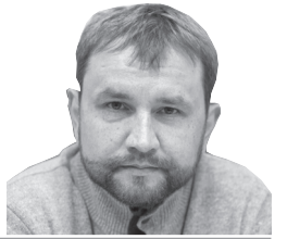
Володимир В'ятрович народний депутат

«Ми сьогодні прийшли сказати: дайте спокій мові, інакше ми не дамо спокою вам».