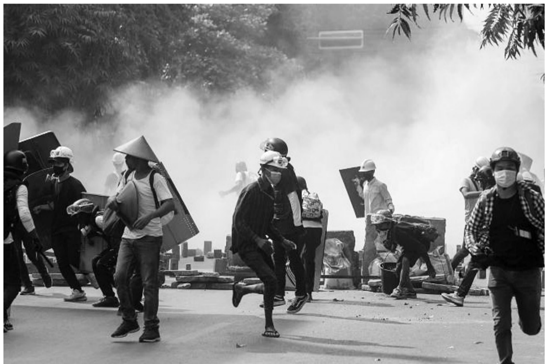
Майдан у М'янмі.

Тим часом Рада Безпеки ООН планує знову зібратися, щоб обговорити ситуацію в цій азійській країні. Як повідомили дрі кілька неназваних дипломатів, Велика Британія звернулася з проханням про проведення 5 березня зустрічі за закрити-