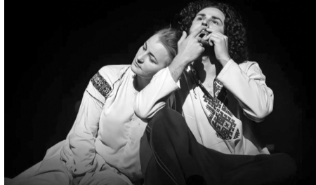
«Солодка Даруся».

І додає: «В Чорнобилі ми не були. Але там не був ще жоден театр — від часу вибуху на ЧАЕС у 1986 році. Тому це, без перебільшення, історична подія — напередодні 35-ї річниці з часу Чорнобильської ката-