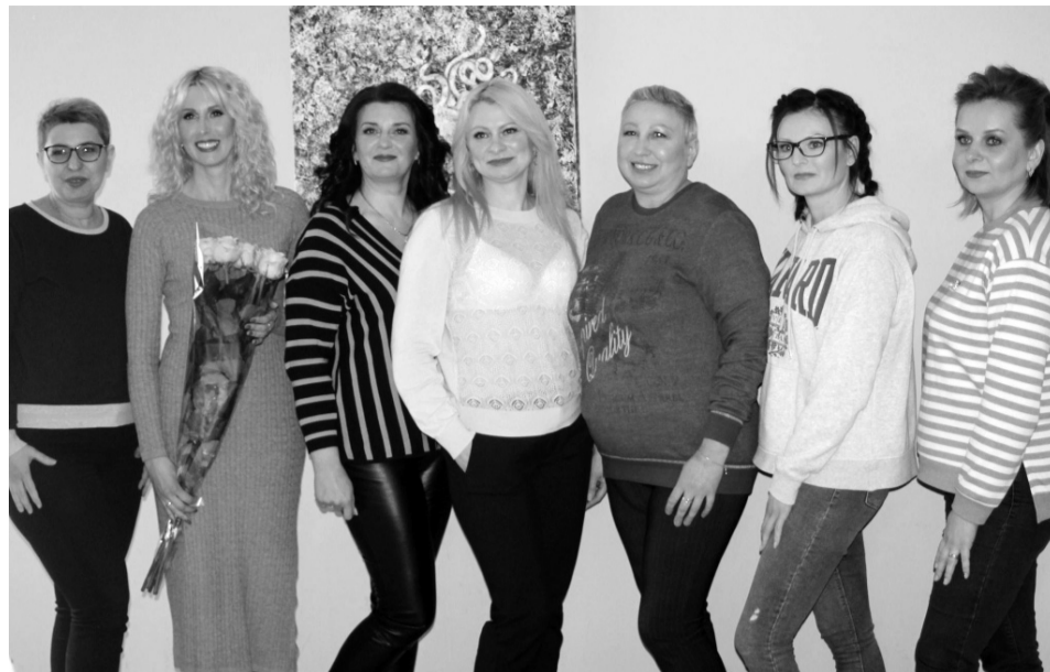
«Рак не вирок» — стверджують ці жінки.