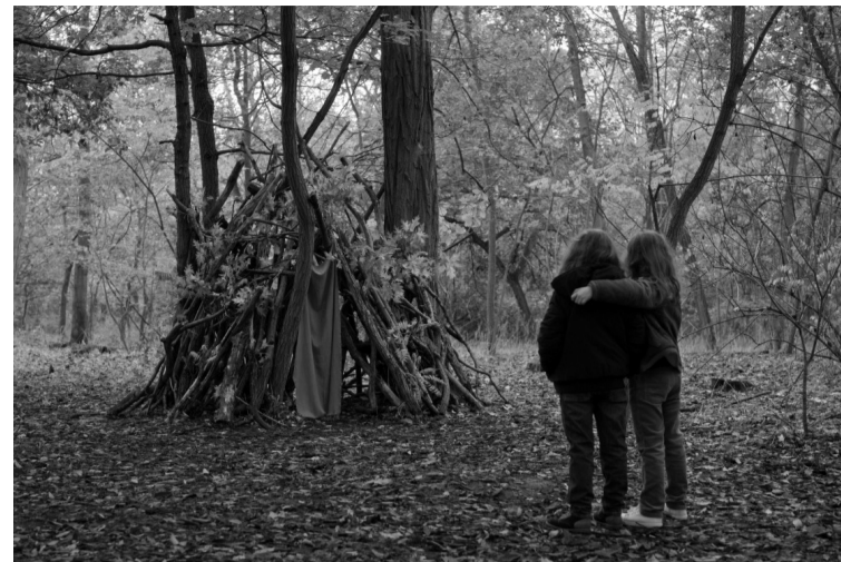
«Маленька мама».

Щоби все це стало зрозумілим для глядачів, далеким від подібних реалій, режисер дає