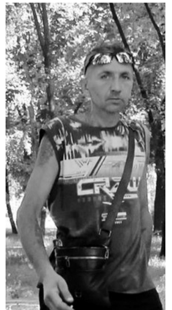
Той, хто несподівано «воскрес».