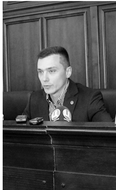
Прокурор Полтавської області Антон Столітній під час пресконференції.

Антон Столітній спростував слова родичів загиблої про те, що правоохоронці не признають експертиз. Насправді, за його словами, на сьогодні призначено 30 експертиз, і значну частину їх уже