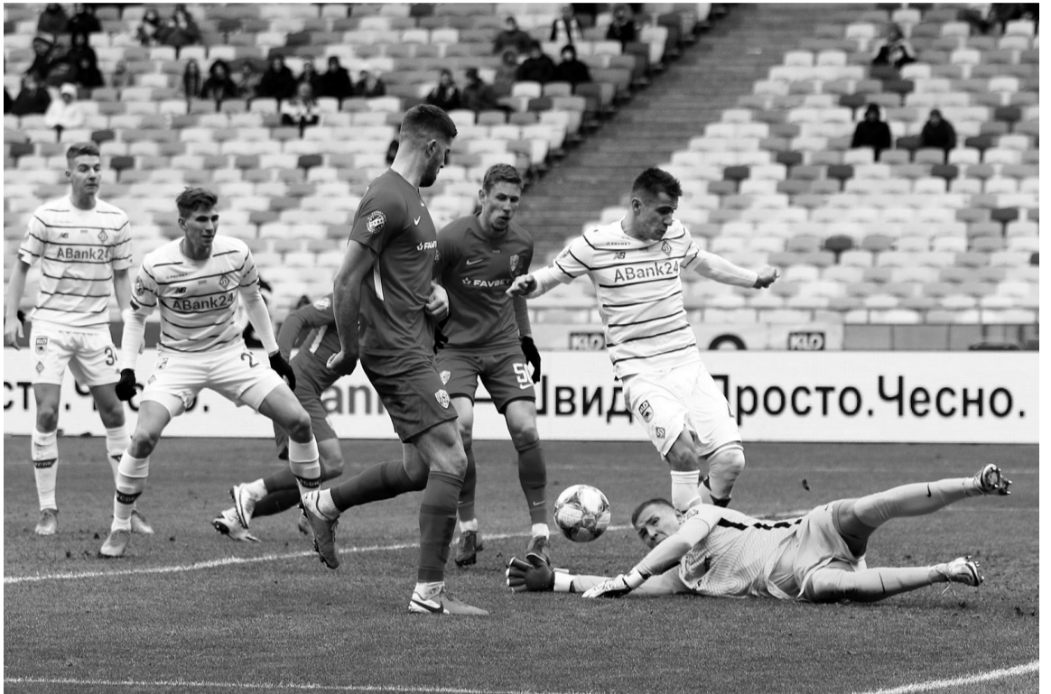
«Минай» знову спробує свої сили серед найкращих команд України.