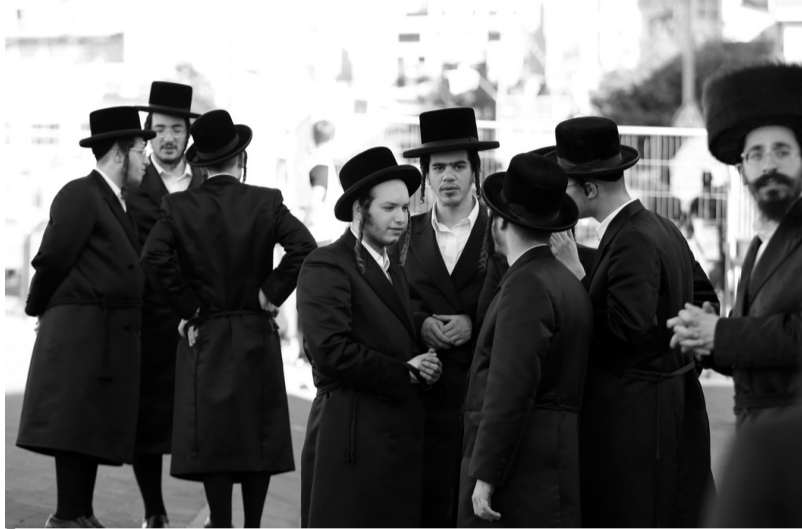
Знайомтеся: нові «українські» латифундисти.

«Надалі землі реалізовувалися членам релігійної спільноти хасидів для будівництва готелів, що використовуються під час паломництва. Було привласнено близько восьми гектарів землі в місті Умань та Уманському районі на загальну суму понад 10 мільйонів гривень», — розповідають у поліції Черкаської області.