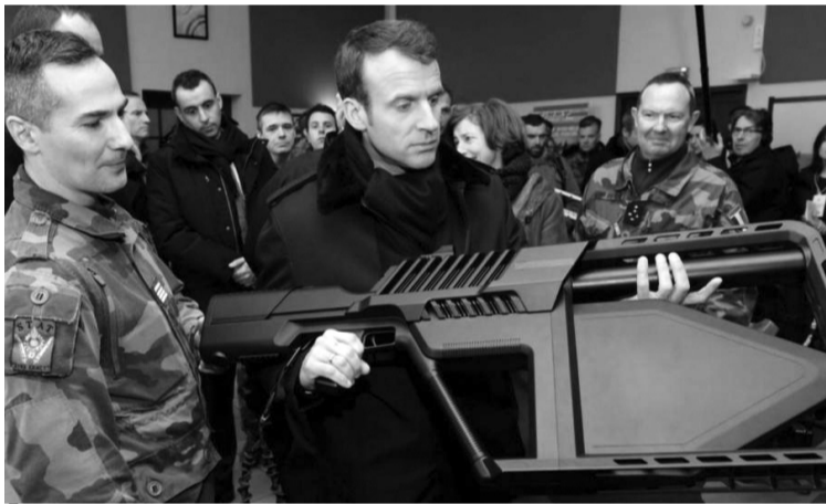
Еммануель Макрон оцінює, за скільки можна продати цю штуку.

«Леонардо» — це найбільший італійський виробник зброї і 12-й за розміром у світі. Його найбільший акціонер — італійський уряд; він володіє 30% акцій компанії. «Леонардо» відмовився викласти журналістам свою позицію з цього питання. «В останні роки, — коментує Франческо Вінярка, — більше половини італійського експорту йде в