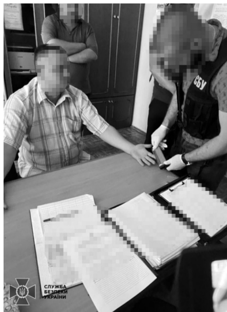
Під час затримання.

Посадовець Держгеокадастру попався на хабарі в 10 тисяч доларів