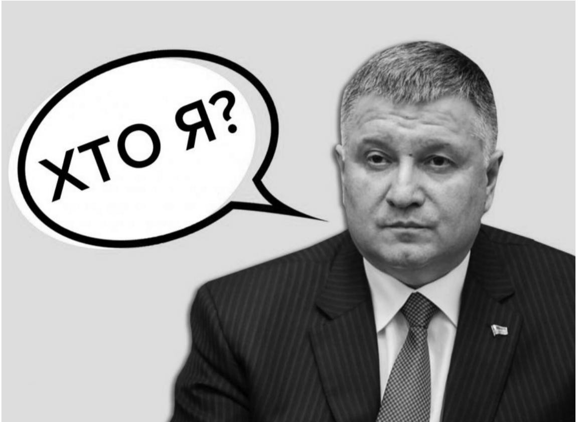
Арсен Аваков: Ну що, зіграємо?

У 2011 році журнал «Фокус» оцінював статки Авакова у 283 мільйони доларів США. Тоді ж політик потрапив у немилість режиму Віктора Януковича та харківської влади і змушений був продати частину бізнесу, зокрема й газовидобувний. Та 2014-го «Інвестор» через суди почав повернення активів.