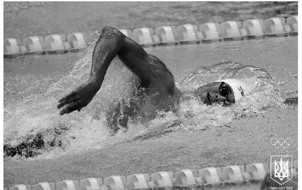
Встановивши олімпійський рекорд у кваліфікації, Михайло Романчук обмежився лише бронзовою медаллю на дистанції 800 м вільним стилем.

Поки ж скарбничка українських олімпійців у Токіо наповнена лише «бронзою». Окрім бронзових медалей Романчука, дзюдоїстки Білодід і фехтувальника Рейзліна, аналогічної якості нагороду туди поклали й представники стрілецького цеху — Олена Костевич та Сергій Омельчук, котрі стали третіми в змаганнях змішаних команд зі стрільби з пневматичного пістолета (дистанція 10 м). У так званій бронзовій перестрелці українська команда перевершила дует із Сербії — 16:12. Зазначимо, що для 36-річної Костевич це загалом уже четверта олімпійська медаль. За словами Сергія Омельчука, у моменти найвищої напруги йому неабияк допомагали слова підтримки досвідченої та титулованої напарниці. «Хвилювання відчувалося упродовж усього турніру, і мені дуже допомагала Олена, вселяючи в мене впевненість. Ми разом працювали