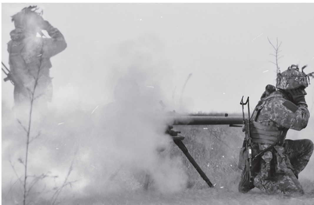
Мир задекларовано лише на папері.

Рік тому набув чинності повний і всеосяжний режим припинення вогню, але росіяни нічого припиняти не збиралися