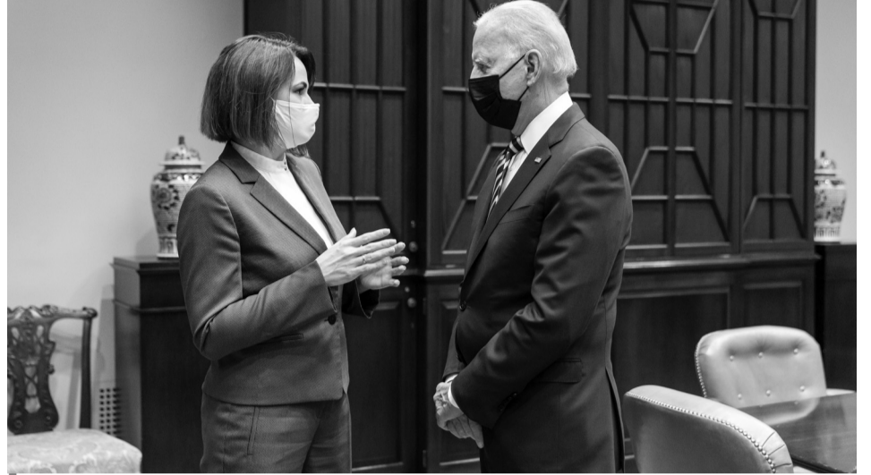
«Сполучені Штати підтримують народ Білорусі», — запевнив президент Байден.

Також на зустрічі у Держдепартаменті Світлана Тихановська закликала США дати сигнал Росії про те, що підписані контракти та угоди з режимом не будуть юридично визнані та анульовані. Крім того, запросила Сполучені Штати взяти активну участь в організації та проведенні конференції високого рівня щодо врегулювання кризи в Білорусі.