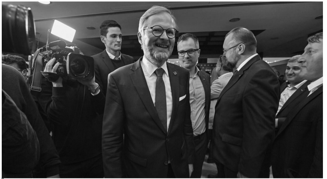
Петр Фіала: прем'єрське крісло наче й поруч, але сісти в нього поки що зась.

У Чехії домовилися про створення нової широкої коаліції