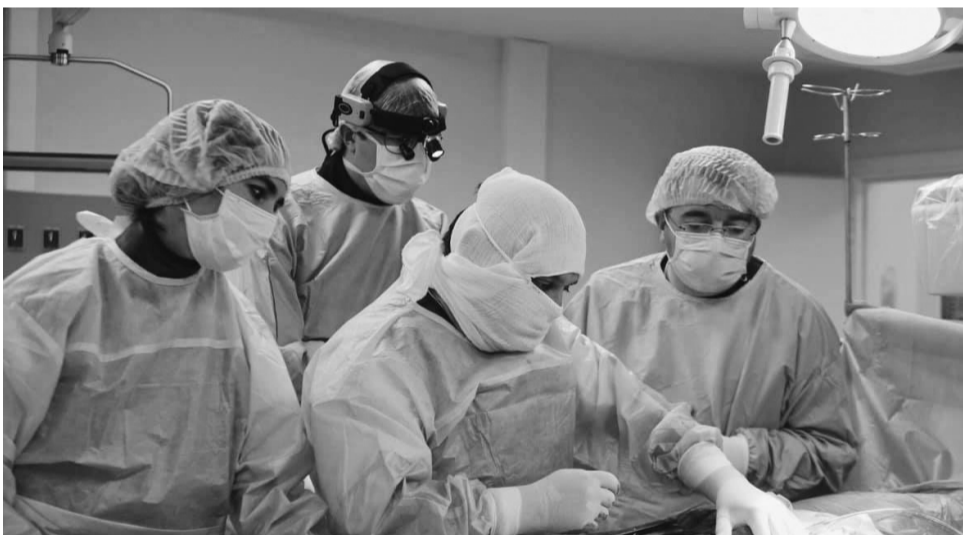
Лікарі Черкаського обласного кардіоцентру вперше замінили серцевий клапан на штучний.

У Черкаському кардіоцентрі провели унікальну операцію: 60-річній пацієнтці замінили серцевий клапан на штучний