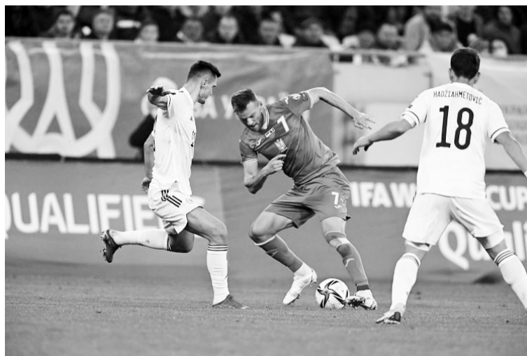
У матчі проти Боснії та Герцеговини Андрій Ярмоленко забив свій 44-й м'яч за збірну України.

На жаль, у грі проти Боснії та Герцеговини українські збірники знову наступили на ті ж самі граблі: дозволили су-