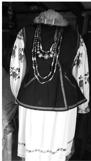
«Надуванці» конотопських красунь.

лені дідусем колекціонера наприкінці 1940 року. «Активно експлуатувалися більше 30 років. Такими саньми селяни перевозили малогабаритні вантажі: дрова, мішки з сільськогосподарською продукцією, — розповідає Олександр. — Вони мали подібну до кінних господарських саней конструкцію, але різнилися меншими розмірами та тим, що приводилися у рух фізичними зусиллями людини. Діти та молодь використовували їх і для зимових розваг».