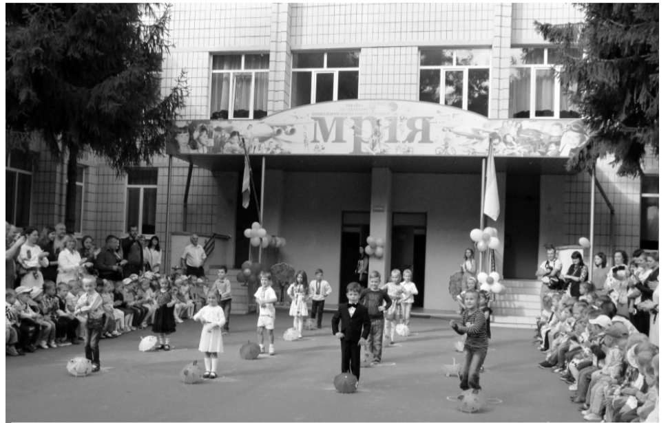
Найбільший з антоновських закладів дошкільної освіти — дитсадок №736 «Мрія» — відвідують 200 дітей.

Японія, Нідерланди, Туреччина, Йорданія та інші. Навіть за відсутності законодавчих вимог багато роботодавців знаходять можливість пропонувати догляд за дітьми і тим самим отримують вищі економічні результати. Компанії пропо-