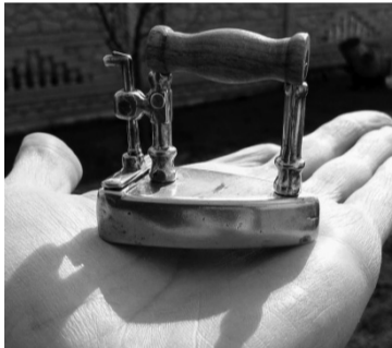
Англійська мініатюрна манжетна праска кінця ХІХ століття.