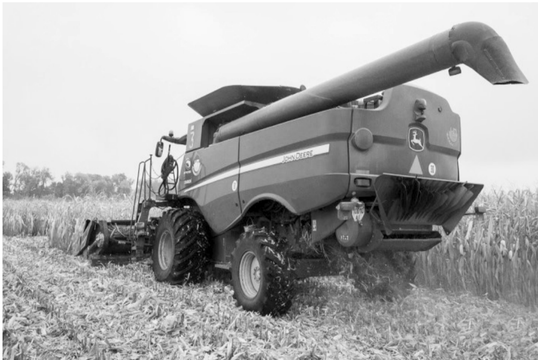
Цього річ в Україні зібрани рекордний урожай двох найголовніших агрокультур — пшениці та кукурудзи. Та чи стане це запорукою доступних цін на основні продукти харчування для населення?

Меґою меморіалу має бути нагадування (і не лише у траурні ювілеї) про всіх наших страчених співгромадян. ■