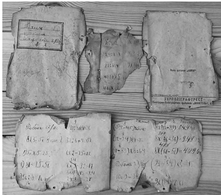
Фрагменти учнівського зошита 1930-х років.

Чисельні колекції в Олександра прасок, м'ясорубок, вагів, ночов, вуликів, вишитих сорочок і рушників. Сани-копанічки в експозиції — зроби-