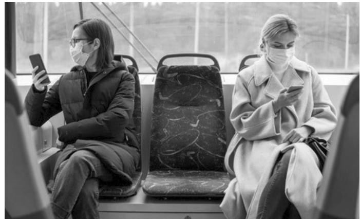
Для поїздок між областями з 21 жовтня слід буде надати свідоцтво про вакцинацію від COVID-19 або ПЛР-тест на захворювання з негативним результатом.

Нагадаємо, від п'ятниці — у «червоній» карантинній зоні Херсонщина. Нині там критична ситуація з киснем у лікарнях. Через український перебіг коронавірусу, який спостерігають наразі у пацієнтів, влада планує відкрити ще один заклад для лікування COVID-хворих. Також стало відомо, що у Павлограді на Дніпропетровщині відсьогодні пільговиків не зможуть безкоштовно проїхати у громадському транспорті. Про це повідомили в міськраді. Йдеться про пенсіонерів та людей з інвалідністю третьої групи. У міськраді таке рішення пояснюють погіршенням ситуації з коронавірусом. І, зокрема, потраплянням регіону до «червоної» карантин-